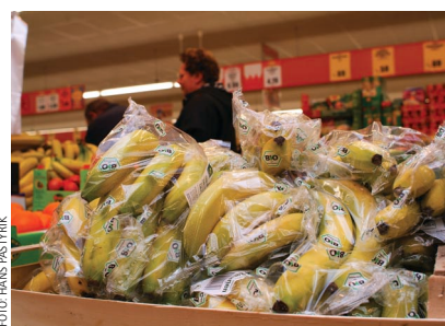
Sensibles Produkt: Nur unbeschädigte Ware kommt beim Verbraucher gut an.

Das neue Transportmittel wurde im Sonderforschungsbereich „Selbststeuerung logistischer Prozesse“ der Uni Bremen entwickelt und am Bremer Microsystems Center wurde ein Prototyp gebaut. Die entwickelte Technik wird jetzt während eines zweijährigen Transferprojektes auf ih-