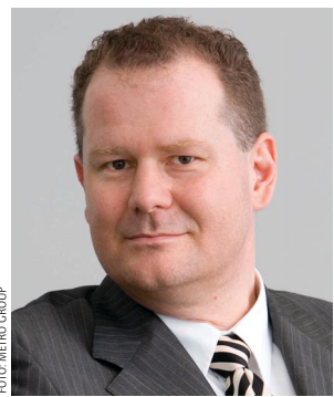
„Wirtschaftliche und ökologische Interessen liegen nicht weit auseinander“